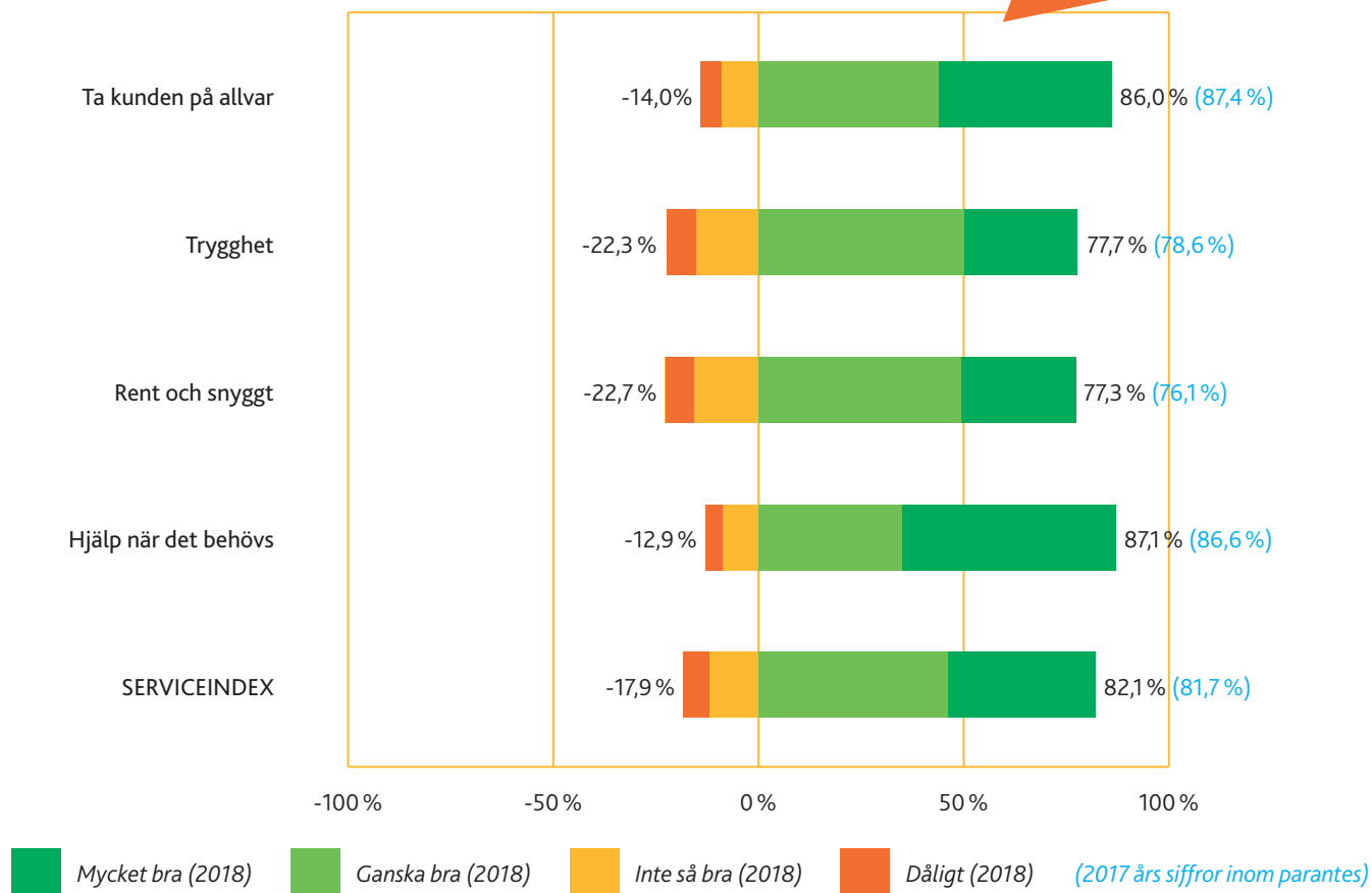
Serviceindex Halmstad 2018

Vill du veta mer om vår kundundersökning? Logga in och läs mer på Mina sidor!